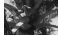
木の上部に青い実がなる

有名なのがココヤシだ。フィリピンやインドネシアの島々では、海岸近くに生える背の高いココヤシが、南国らしい景観を作っている。