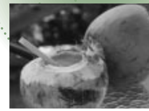
生のジュースは見た目もトロピカル

頭を切ったヤシの実にストローをさして飲むのがこの果汁。無色透明でほんのりと甘いココナツジュースは、胃への吸収が優れている。そのため天然のスポーツドリンクとして人々の喉を潤してきた。また、この果汁は植物の組織培養のときにも使われるが、これは細胞の成長を促す作用があるため、身体にいいのも納得。