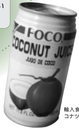
輸入食材店にはココナツジュースも