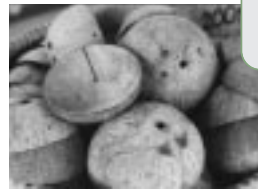
そのまま乾燥させればお皿に

猿の顔に似ている内果皮。球状の固い殻は、プラスチックが出回る以前は、あらゆる容器として利用されていた。刃物で細工するにはほどよい堅さで、貯金箱や菓子入れ、シャモジや楽器として活躍。最近では装飾用のランプやアクセサリなどにも加工されている。燃やすと質のよい活性炭ができ、炭ブームの一角を支えている。