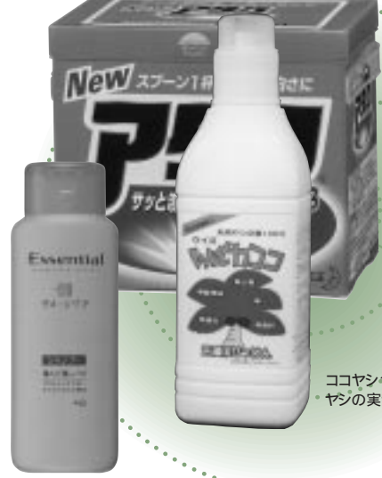
おなじみのシャンプーにも