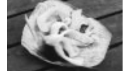
若い果実の胚乳は刺身としても

ココヤシは、1本で1年間に50個以上の実が採れ、寿命は約60年。毎年多くの恵みを与えてくれる。工業製品や西洋文化に押されぎみだが、エコロジー指向の21世紀、天然素材として見直されている。