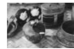
実や木で作られる小物

いる。ココヤシのココトはポルトガル語で猿の意味で、猿の顔と似ているから猿のナツツというわけだ。