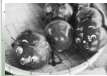
お土産に売られているお菓子入れ