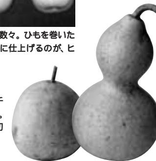
ヒョウタンの基本形とされる千成(右)は、長さ13センチ以下。プランターでも作りやすく、初心者でも栽培しやすい