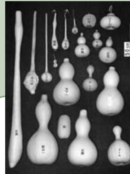
形も大きさも多種多様なヒョウタンの数々。ひもを巻いたりねじったりしながら、いろいろな形に仕上げるのが、ヒョウタン栽培の楽しみでもある

ヒョウタンといえば、神社・仏閣で見られる縁起物や七味唐辛子入れをイメージする人も多いだろうが、実はキュウリやメロンなどと同じウリ科に属し、ユウガオと同種の植物の果実。トックリのようにくびれを持つ形がよく知られているが、形や大きさはさまざま。世界最古の栽培作物ともいわれ、用途も歴史も奥が深い。