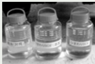
軽油、ヒマワリのバイオディーゼル油、ヒマワリのバイオディーゼル油+添加剤(ヒマワリから製造)での走行テストも行っている

この事業は現地での期待も大きい。同社では油かすの飼料化や葉のたい肥化、はちみつ作りなど、新しい産業創出も視野に入れている。実用化に向けたヒマワリの栽培は05年秋から始まる予定だ。