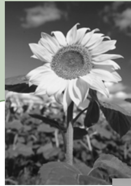
切り花用の小さなものから高さ数メートルのものまで、100種類以上もの品種がある。採油用の品種には、花の直径が40～50センチにもなるものもある

夏の花といえば、代表的なのがヒマワリだ。「向日葵」のほかに「望日葵」「日輪草」「向陽花」「太陽花」などの別名を持ち、さらに英語では「サンフラワー」と呼ばれるなど、ヒマワリは夏の日差しによく似合う。観賞用として楽しむのが一般的だが、実は花びらや種から茎、根まで利用できる優れた植物なのだ。