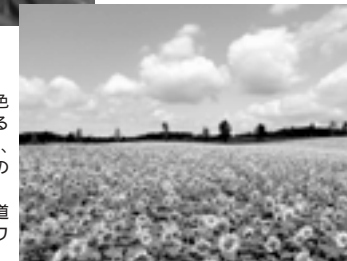
青空の下に金色の花を咲かせるヒマワリ畑は、夏らしい風景の代表だ (写真は北海道北竜町のヒマワリ畑)