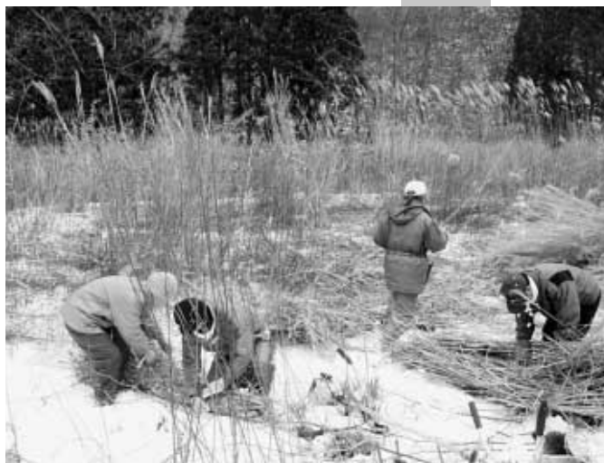
今年の活動に備えて昨年11月に寒さの中で行った茅刈り