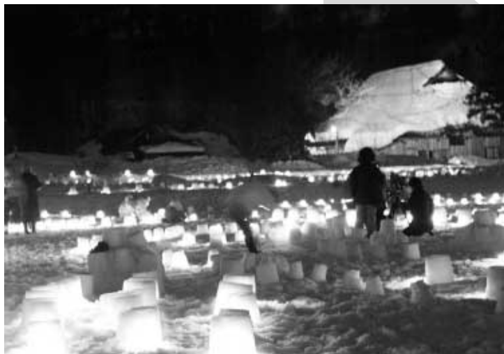
暖かな口ウソクの明かりが手這坂を包み込む冬の雪灯籠

http://www.shirakami.or.jp/~minehama/tehaizaka/kayabuki/tougenzyoho.htm