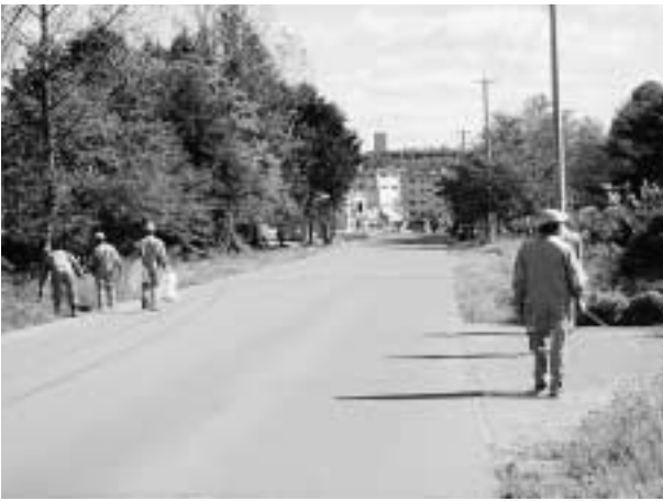
工場周辺のクリーンアップを行っています