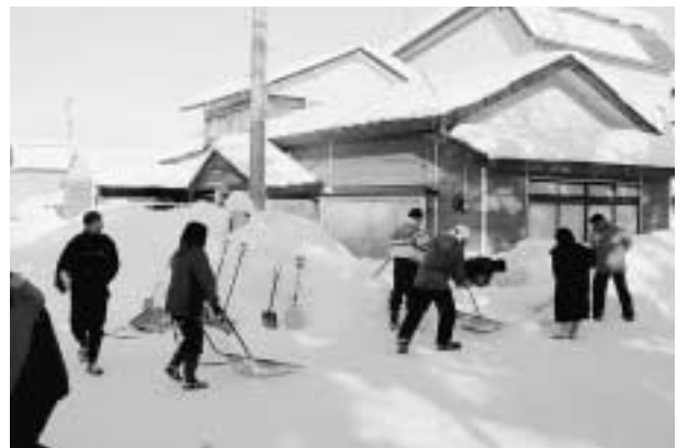
除雪ボランティアに 1 件あたり 8 人位で参加しています