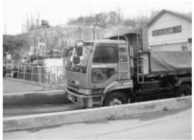
廃棄物搬入後のトラックはタイヤ洗浄して場外へ出ています