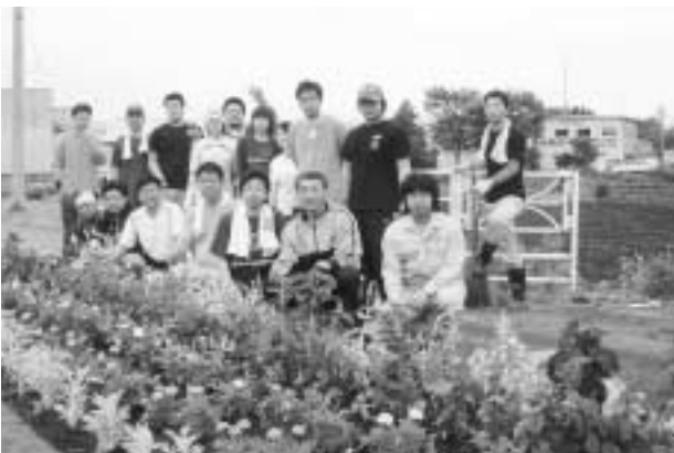
国道沿いの花壇整備を行っています