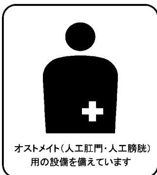
オストメイト(人工肛門・人工膀胱)用の設備を備えています