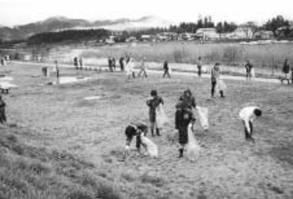
長木川クリーンアップに毎年 40 名程が参加しています