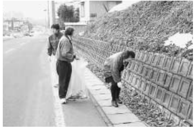
会社周辺の清掃活動を行っています