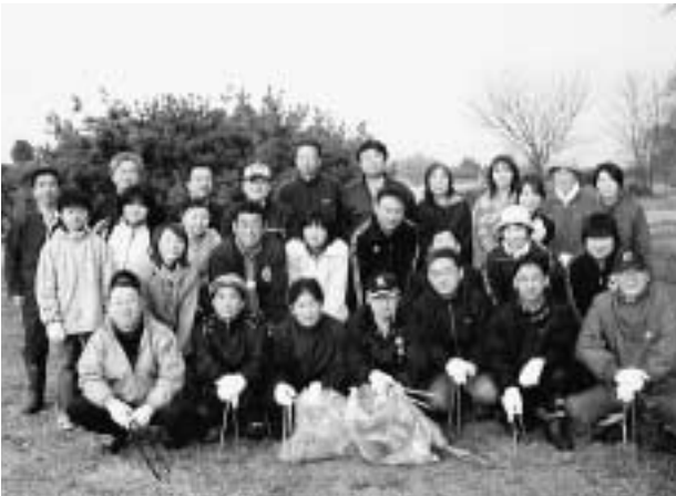
長木川クリーンアップに参加しています