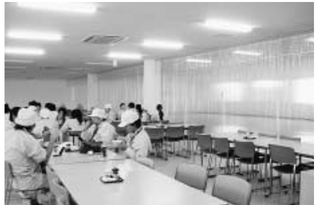
食堂をカーテンで間仕切り節電につなげています