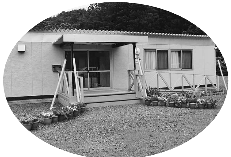
岩手県大槌町の仮設住宅団地内にある集会所入り口には、ボランティアが持ってきた花々が並べられていました。

このほかにも銀行の預金利子の寄付、ネット購入時のポイント寄付などいろいろな取り組みが始まっています。個人が継続的に大金を寄付するのは難しいですが、こうした企業の取り組みを積極的に活用しながら暮らすことで、被災地の復興支援につながることも意識してみたいかがでしょうか。