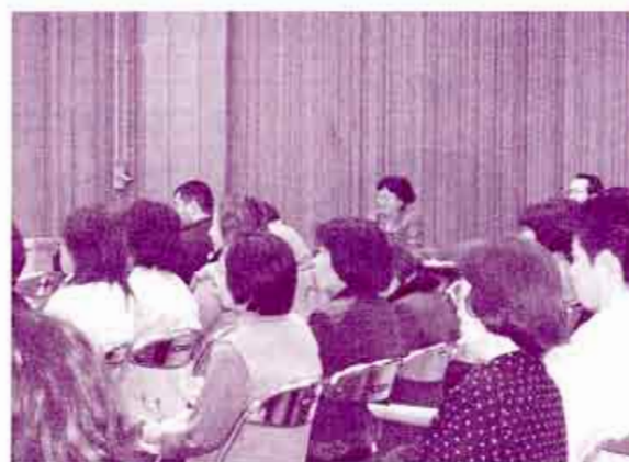
熱心に聞き入る参加者。微笑みあり、涙ありの講演となりました

の活動に際して陰に日向に応援していただけるようになりました。その方々の辛く苦しい思いを、今後も忘れずにいたいと考えています。