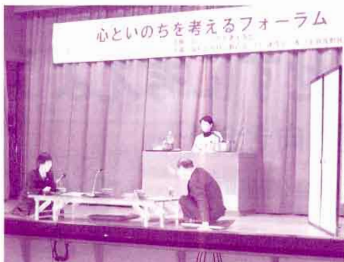
寸劇『生きるチカラ』より。家族が長女にいい大学へ入るように激励します

自殺に対するタブー視や抵抗感から、結成当初は活動の難しさを強く感じました。特に身内の自殺を経験された方への配慮は十分必要となります。慎重に接しているうちに徐々に理解を示してくれる方が増え、自殺を地域や社会の問題として、タブー視せずに考えようという意識が高まってきたように思います。自分の家族や大切な方を自殺によって亡くされた方々も、当会