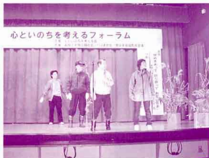
同劇より。白神山地に山歩きにでかける家族。途中、道に迷ってしまう長女