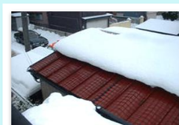
屋根用融雪ネット「雪ん子」