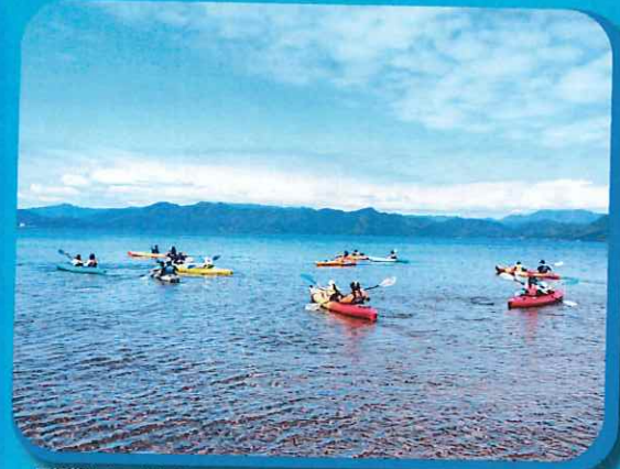
田沢湖カヤック体験(イメージ)