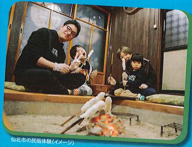
仙北市の民宿体験(イメージ)