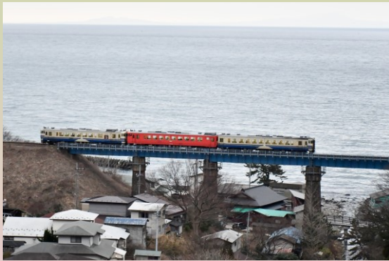
令和3年まで五能線を走った気動車「キハ40系」