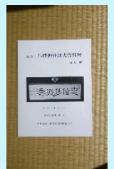
文化財保護協会能代支部発刊資料