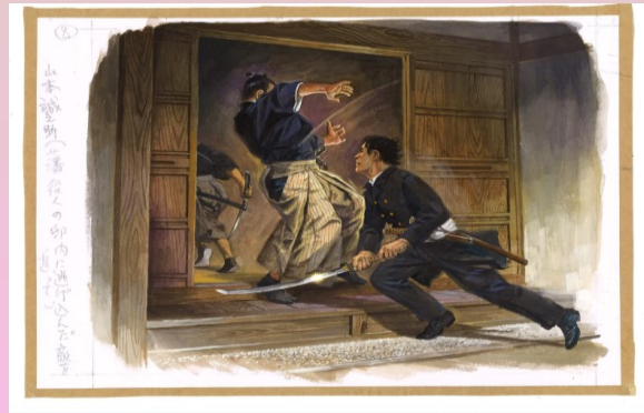
幕末・明治を生きた風雲児『山本誠之助』