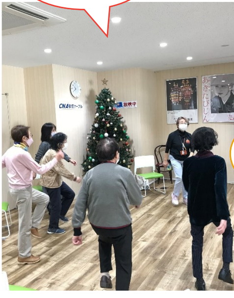
15分間のインターバル歩行