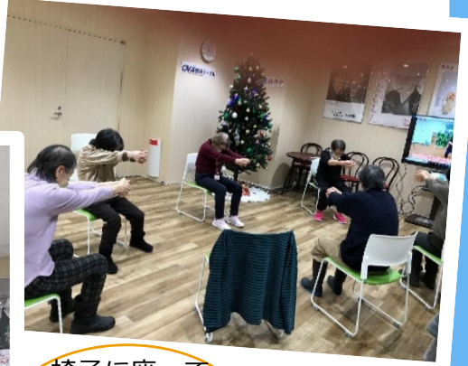
椅子に座って十分なストレッチ