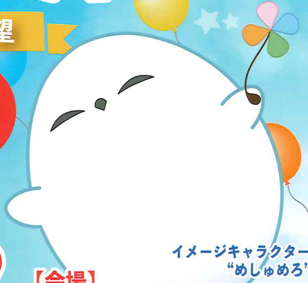
イメージキャラクター “めしゅめろ”