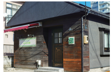
仙台市太白区長町1丁目12-14 NPO法人 おりざの家