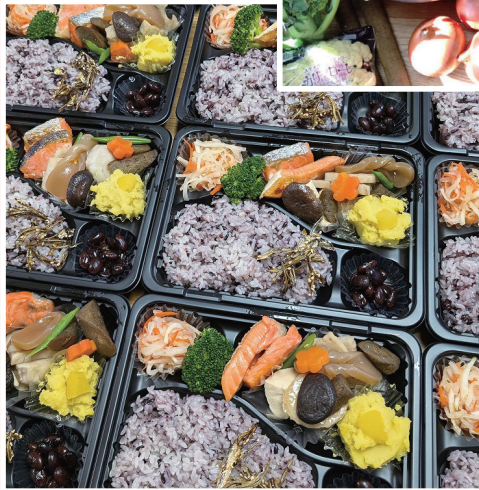
おりぎの家の メニュー例