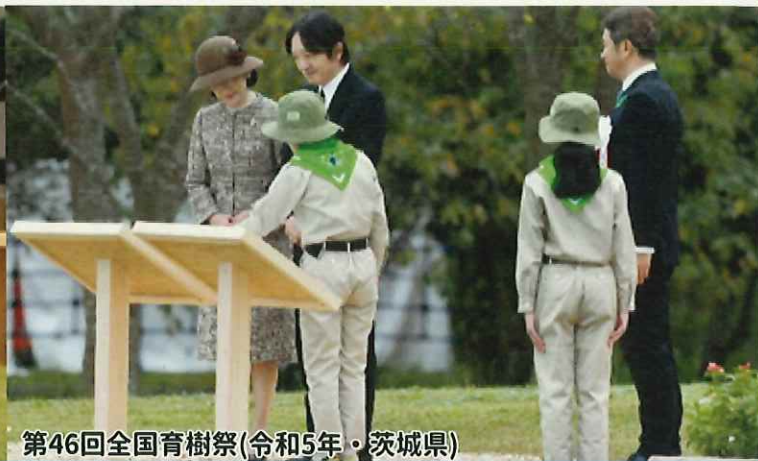
第46回全国育樹祭(令和5年・茨城県)