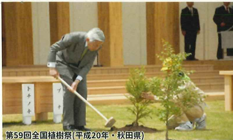
第59回全国植樹祭(平成20年・秋田県)