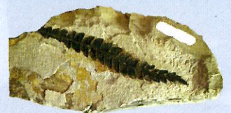
ナウマンヤママモ

この時代の地層は秋田県に広く分布しています。その多くは日本海ができ始めてから今の日本列島になるまでの時期に形成され、黒鉱や石油など多くの地下資源が生み出されました。また、堆積岩層からは多くの化石が見つかり、当時の環境が復元されています。