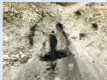
原油のしみ出し (黒川油田)