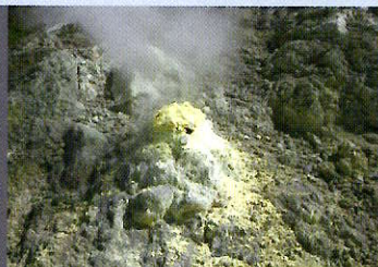
玉川温泉の噴気孔