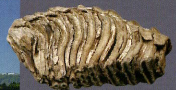
ナウマンゾウの歯

第四紀は現生につながる時代です。火山や温泉、現在の地形の大部分はこの時代に造られました。