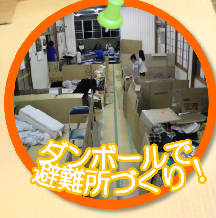
ダンボールで、 避難所づくり！