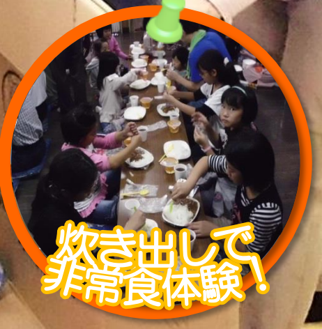
炊き出して、 非常食体験！