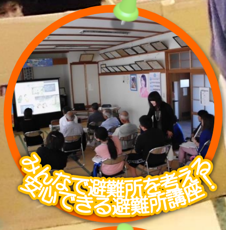
みんなで避難所を考え、 安心できる避難所講座