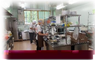
お弁当事業 「くう兵衛」

障がい者の就労支援として、ドクダミや笹の葉などを使用した野草茶づくり、手芸製品の製造作業、メール便やペットボトルのキャップ選別作業など、様々な事業を展開しています。中でも、今一番力を入れているのは「くう兵衛」のお弁当事業です。もともとは、鹿角市の高齢者向けお弁当事業を、社会福祉協議会から受託して製造から販売まで行っていて、今は一般向けの販売も行っています。ヘルシーなメニューが多いようなので、女性にもぴったりのお弁当です。ぜひお試しください。