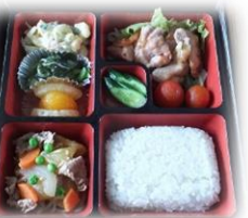
美味しそうなお弁当

特定非営利活動法人 鹿角親交会 秋田県鹿角市花輪字寺ノ後36-2 電話 0186-22-7166