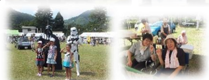
子供たちも 地域のお母さんも 楽しめるイベント