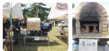
大葛自慢の手作りピザ窯「竜チャン豪」