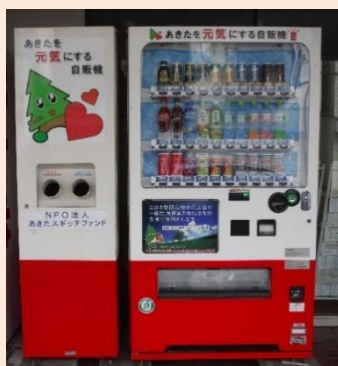
スギッチ君のマークが目印です。

清涼飲料水の販売業者への働きかけで、現在5社があきたスギッチ応援自販機をトータルで58台設置しており、販売額の数%を寄付しています。北部男女参画センター前にも設置されています。