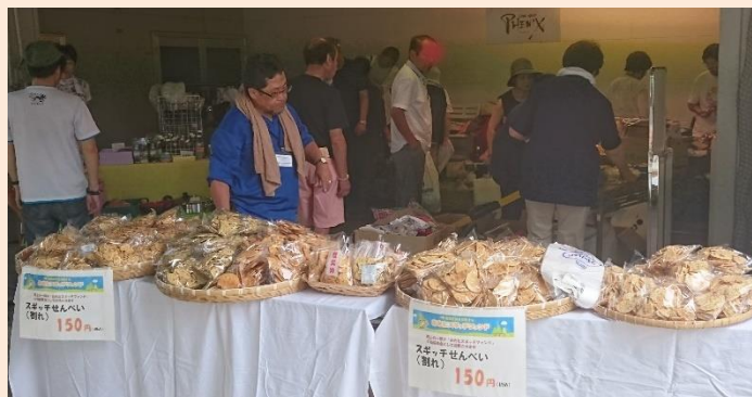
スギッチせんべい販売風景

いなふく米菓のせんべいを仕入れて、スギッチせんべいとして県内各地イベント等で販売し、その売上げ一部をスギッチファンドに寄付する活動です。