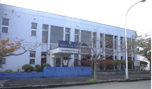
勤労青少年ホーム正面風景、広い駐車場あり

2016年1月より能代市市民活動センターのホームページが新しくなりました。団体情報やガイドブックのダウンロード、印刷が出来ます。 http://noshiro-npo.com/