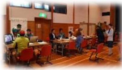
交流会の様子。つながりは幾重にも

※次回開催 県南地区交流会 - 11月2日(土) / 湯沢市ふるさとふれあいセンター