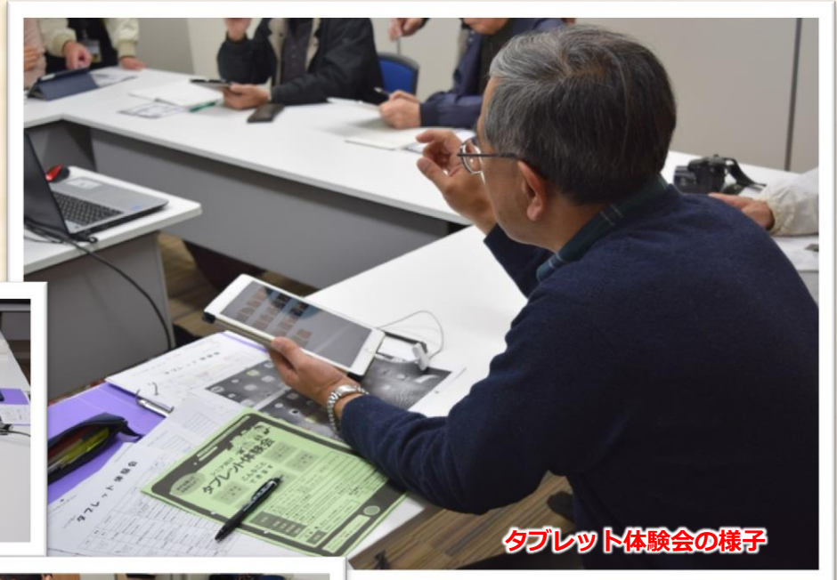
タブレット体験会の様子