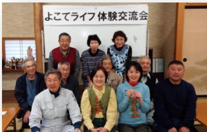
参加者と三又地区の皆さん

今回の企画にご協力していただいた山内三又地域の方々の、気さくな対応が、お二人の緊張を解いていたのが、笑顔を見て分かりました。