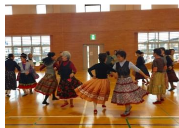
リズムに合わせて楽しく踊るサークルの皆さん

プチ旅行、クリスマスパーティなどを役割分担しながら企画・準備をする。仲間同士の楽しみやふれあい、一体感がさらにメンバーを輝かせていくのかもしれない。