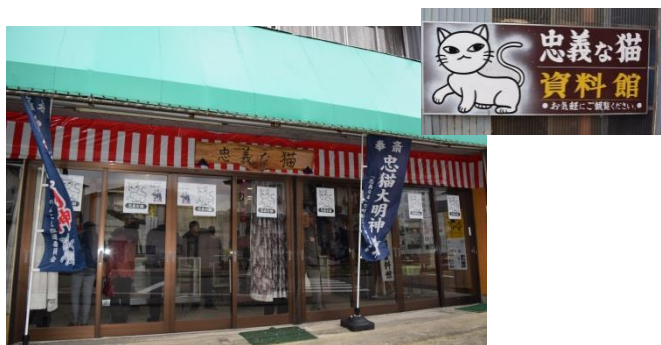
忠義な猫資料館入口と看板

7月号で取材させて頂いた忠義な猫の会が、クラウド・ファンディングを活用して資料展示と石碑保護を目的とした資料館が開設しました。「忠義な猫」の石碑は石質が良く、年月を経た今でも、形を保ったまま問題なく移転でき、当時いかに大切にされたのかがわかったそうです。資料館の施設内には、今までの活動紹介や忠義な猫の紙芝居や自分達が作った歌なども展示されていました。忠義な猫の会と地元菓子店が共同開発した猫サブレは、子どもの頃食べたホッとのお菓子の味がしました。