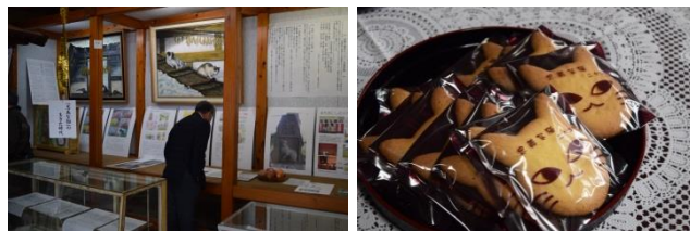
忠義な猫資料館展示状況と「忠義な猫サブレ」