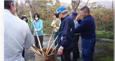
地域に伝わる餅つき体験