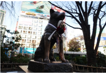
正月の渋谷ハチ公像

かつて大館犬と呼ばれていた秋田犬（あきたいぬ）は、いまや県を代表するキャラクターになりました。渋谷のハチ公像はあまりにも有名ですが、彼の魂はいまどこに眠っているのでしょうか