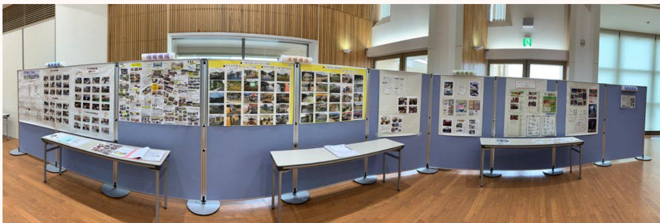
会場後方の自治会活動のパネル展示では掲示物の前で情報交換する姿もみられました